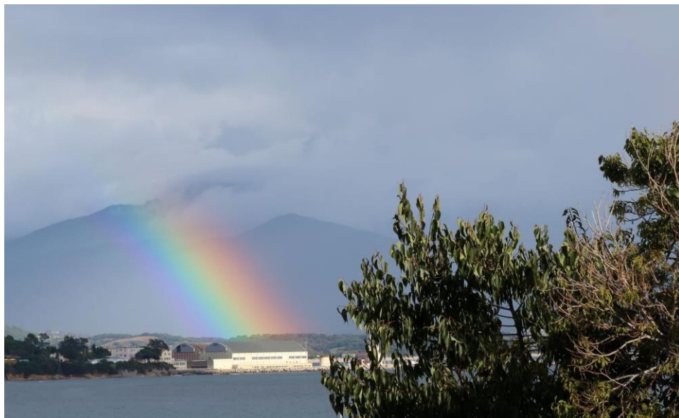
Après les AG de l'Eglise et de l'Entraide : Arc-en-Ciel devant Ste Lucie !